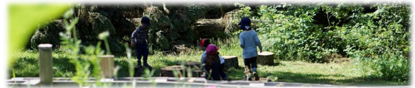
Abbildung 16: co.natur gGmbH Waldkindergarten Heimsheim

Wir nehmen das Kind als Menschen wahr und begegnen ihm auf Augenhöhe, wir trauen dem Kind etwas zu und lassen es viele Entscheidungen selbst treffen und viele Aktivitäten selbst ausführen. Wir fördern das eigenständige Denken und Handeln und wollen, dass Kinder Vertrauen in sich und ihre Gestaltung des Lebens entwickeln.