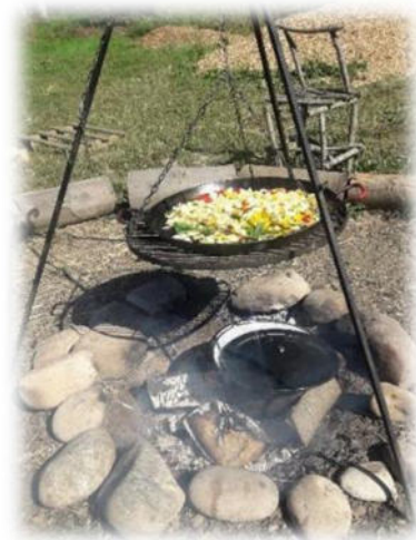
Abbildung 18: co.natur gGmbH Waldkindergarten Heimsheim

Wir vertreten die Ansicht, dass Kinder, denen man viel zutraut und die viele praktische Dinge lernen dürfen, ein starkes Selbstwertgefühl entwickeln und sich selbst vieles zutrauen.