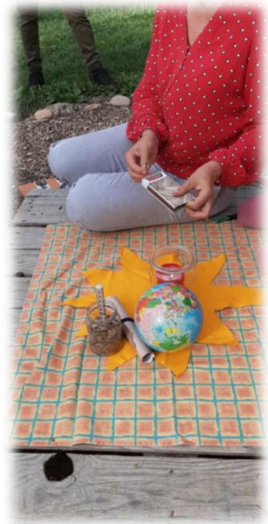
Abbildung 36: co.natur gGmbH Waldkindergarten Heimsheim

Wichtig hierbei ist nur die Art und Weise, diese Fehler zu betrachten, zu bewerten und damit umzugehen. Um einen konstruktiven Umgang mit Fehlern gewährleisten zu können, müssen sie offen benannt, eingestanden und aufgearbeitet werden und können so zur Verbesserung unserer Arbeit führen. Fehlverhalten oder Sachverhalte, deren Sinn und Hintergrund nicht verstanden werden, sprechen unsere Mitarbeitenden offen bei Kollegen und Kolleginnen, im Team und