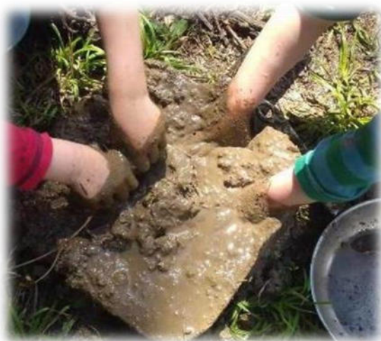
Abbildung 20: co.natur gGmbH Waldkindergarten Heimsheim

Wenn wir unsere Kinder ernst nehmen, dann sollten wir sie an der realen, ernsthaften Lebenswirklichkeit teilhaben lassen. Und da sind es vor allem die alltagstauglichen Fertigkeiten, die zählen: Arbeiten, die Tag für Tag in der Lebensgemeinschaft Familie oder in einer Kindertageseinrichtung anfallen, die getan werden müssen, um die Versorgung dieser Gemeinschaft zu gewährleisten. Dabei eröffnet sich ein Betätigungsfeld, das weit über die Nahrungszubereitung hinausgeht.