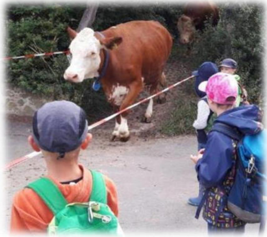
Abbildung 22: co.natur gGmbH Waldkindergarten Heimsheim

Im Kindergarten und in Familien mit zwei und mehr Kindern sind die Voraussetzungen gut. Kinder, die Wissen weitergeben, profitieren u.a. sprachlich und entlasten Erwachsene. Es müssen nicht immer die älteren Kinder sein, die als Wissensvermittler agieren. Kompetenz ist das entscheidende Qualifikationsmerkmal, verbunden mit der Fähigkeit, das Erlernete anschaulich und in logischer Folge zu präsentieren.