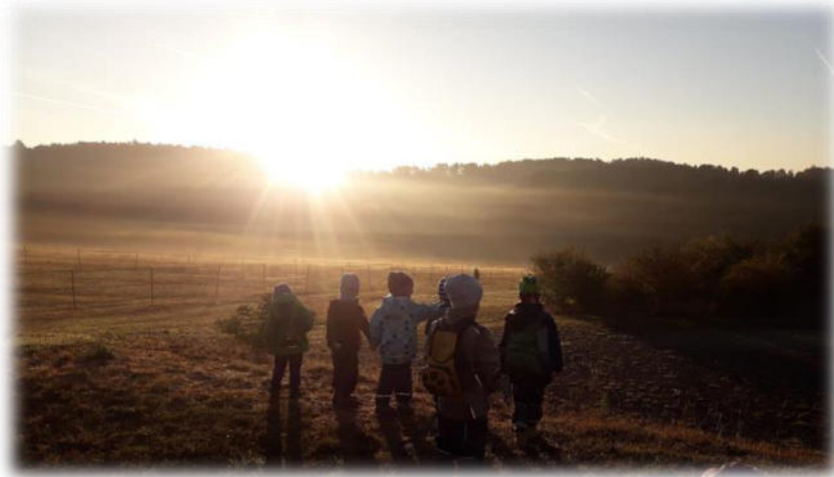
Abbildung 9: co.natur gGmbH Waldkindergarten Heimsheim