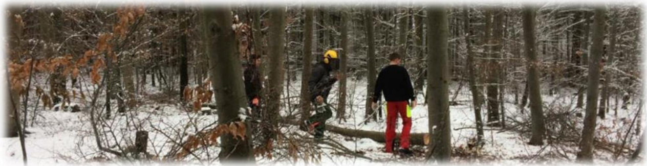
Abbildung 7: co.natur gGmbH Waldkindergarten Heimsheim

Zu den üblichen Gefahren gehören auch lose Äste in großer Höhe. Um sie zu entfernen, kommen regelmäßig Baumpfleger und überprüfen unsere Waldplätze, an denen wir uns vermehrt aufhalten. Es gibt eine erhöhte Verkehrssicherungspflicht in den Waldgebieten, die wir verstärkt nutzen und die markiert sind. Die Verkehrssicherung macht der Baumpfleger oder Baumpflegerin in Abstimmung mit den Forstbeschäftigten. Bei Forstarbeiten wird ein ausreichender Sicherheitsabstand eingehalten.