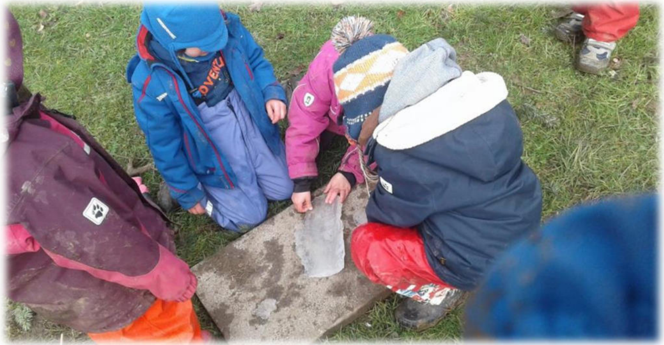
Abbildung 29: co.natur gGmbH Waldkindergarten Heimsheim

Ein wichtiger Bestandteil unserer pädagogischen Arbeit ist das Dokumentieren von Beobachtungen. In regelmäßigen Abständen wird der Lern- und Entwicklungsstand eines jeden Kindes schriftlich festgehalten. Unsere Beobachtungen halten wir anhand mehrerer Beobachtungsbögen fest. Diese beinhalten das Sprachverhalten und das Sprachverständnis, die kognitive Entwicklung, das Spiel-, Lern- und Sozialverhalten, die Wahrnehmung und Orientierung sowie die Motorik.