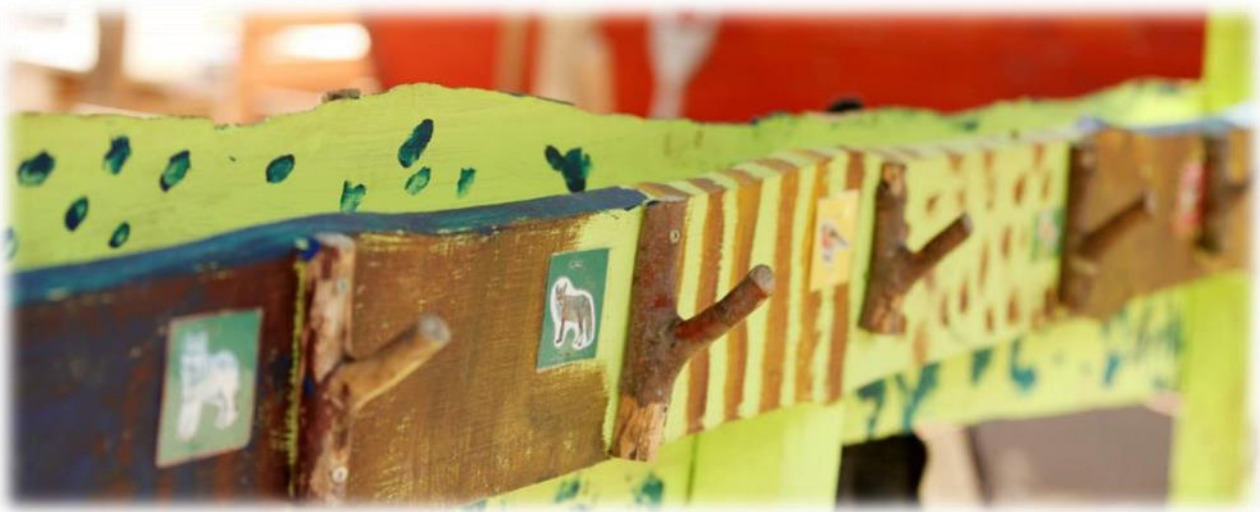
Abbildung 28: co.natur gGmbH Waldkindergarten Heimsheim