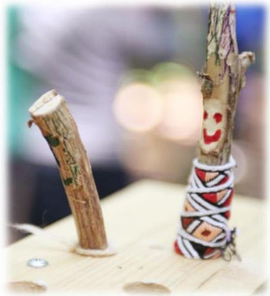
Abbildung 26: co.natur gGmbH Waldkindergarten Heimsheim

Den Kindern werden viele Fragen gestellt, um sie zum Mitdenken zu ermuntern. Durch das Abzählen einzelner Dinge, die gesammelt werden und auch das Abzählen der Kinder im Begrüßungskreis, etc. wird das Konzept der Mengen aufgegriffen. Gesammeltes Material wird zum Basteln in verschiedene Kategorien (z.B. nach Farbe oder Form) eingeteilt. Die Mitarbeitenden erklären, lassen ausprobieren und experimentieren. So können die Kinder möglichst viele Erfahrungen sammeln und eigene Antworten finden. Durch das eigene Anbauen von Gemüse und Obst sowie durch das Spielen im Garten oder im Wald entwickeln die Kinder eine Wertschätzung gegenüber der Natur. Auch Regeln werden mit den Kindern gemeinsam aufgestellt. Der Grund dieser Regeln wird besprochen und bei Bedarf verändert.