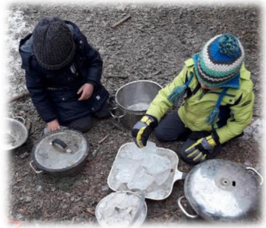
Abbildung 17: co.natur gGmbH Waldkindergarten Heimsheim

Wir bestrafen nicht, grenzen nicht aus, maßregeln nicht und drohen auch keine „Pseudo-Konsequenzen“ an. Wenn ein Kind nicht das machen will, was gerade getan werden sollte, dann hat das selten mit Trotz oder dem Austesten von Grenzen o. Ä. zu tun. Ganz im Gegenteil, das Kind sucht meist nach Beziehung. Das verstehen wir als Auftrag: Beziehungsarbeit und Vertrauen. Wenn ein Kind „augenscheinlich“ nicht mitmacht, dann fragen wir uns „Wie kann ich die Beziehung zu diesem Kind stärken“. Meist spüren Kinder intuitiv die innere Haltung, d.h. diese gilt es dann zu reflektieren und zu überprüfen.