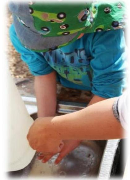
Abbildung 6: co.natur gGmbH Waldkindergarten Heimsheim

Das Toilettenpapier wird hiervon getrennt aufbewahrt. Auch bei längeren Frostperioden sind im Wald häufig noch unter Laubresten nicht durchgefrorene Bodenbereiche zu finden. Bei dauergefrorenem Boden können die Exkremente nicht vergraben werden, dann werden Hundekottüten verwendet. Ggf. werden in einem markierten Bereich auch kleine Gruben vor der Dauerfrostperiode ausgegraben, die dann genutzt werden und mit Laub oder Rindenmulch abgedeckt werden. Werden für die "Waldtoilette" Toilettensitze, Töpfchen ohne Boden oder WC-Brillen verwendet, werden diese nach jeder Benutzung mit geeigneten Reinigungsmitteln gereinigt.