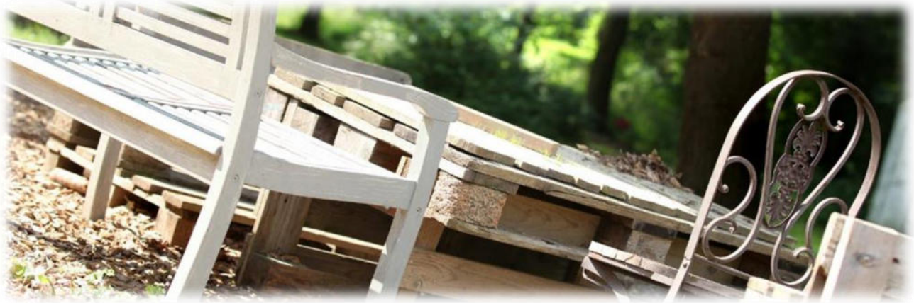
Abbildung 14: co.natur gGmbH Waldkindergarten Heimsheim

Die Teamsitzungen finden wöchentlich statt.