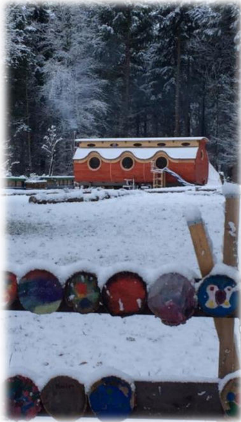
Abbildung 1: co.natur gGmbH Waldkindergarten Heimsheim

Die Wald- und Naturkindergärten haben ihren Ursprung im Jahr 1892 in Schweden. In Deutschland wurde 1968 der erste Waldkindergarten in Wiesbaden genehmigt. Der erste deutsche staatlich anerkannte Waldkindergarten wurde aber erst 25 Jahre später, 1993, in Flensburg eröffnet. Er wurde von Kerstin Jepsen und Petra Jäger gegründet. Sie hatten eine Zeit lang in Dänemark hospitiert, wo es viele Waldkindergärten gibt. Durch intensive Öffentlichkeitsarbeit und viele Besucher des Waldkindergartens in Flensburg wurde die Idee in ganz Deutschland weitergetragen.