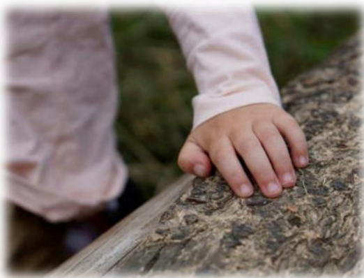
Abbildung 15: co.natur gGmbH Waldkindergarten Heimsheim

Sie sind ein wichtiger und wertvoller Teil der Gemeinschaft und haben dieselben Rechte, wie die Erwachsenen. Kinder wollen dazugehören und sie wollen wachsen. Sie haben Stärken und Schwächen, diese dürfen und sollen gelebt und gezeigt werden dürfen.