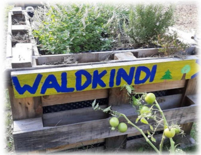
Abbildung 37: co.natur gGmbH

Die Kinder nutzen im Kindergartenalltag oft informelle Wege, um ihre Unzufriedenheit zu äußern. Sie äußern ihre Beschwerde nicht immer eindeutig und direkt. Dabei müssen sie sicher sein, dass ihre Anliegen ernst genommen werden. Auf die Festlegung einer "Beschwerdestelle" oder eines starren Verfahrens haben wir ganz bewusst verzichtet. Unsere Erfahrung ist, dass sich die Kinder in aller Regel an Mitarbeitende ihres Vertrauens wenden, wenn sie Anliegen haben und sich besprechen wollen. Diese selbstgewählte Person des Vertrauens steht den Kindern im Alltag unmittelbar zur Verfügung und ist sozusagen die erste, entscheidende Beschwerdestelle.