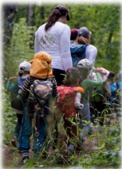
Abbildung 35: co.natur gGmbH Waldkindergarten Heimsheim

Unser höchstes Anliegen ist es, Kinder in ihren Rechten zu stärken und sie so vor körperlichen und seelischen Verletzungen zu schützen. Die uns anvertrauten Kinder haben ein Recht auf eine „sichere“ Einrichtung. Aus diesem Grund werden unsere Mitarbeitenden weder offene noch subtile Formen von Gewalt, Grenzverletzungen oder Übergriffe an den Kindern vornehmen bzw. wissentlich zulassen oder dulden, wie z. B.: