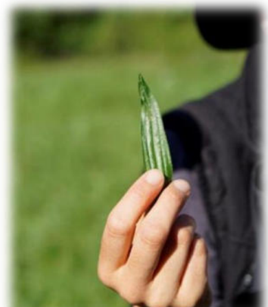
Abbildung 23: co.natur gGmbH Waldkindergarten Heimsheim

„Alles zu seiner Zeit“? Ja, bitte! Was wollen Eltern einem Schulkind noch bieten, das durch eben solche Vorwegnahmen nur desinteressiert antworten kann: „Alter Hut, das kenn' ich schon!“ Auf der Strecke bleibt das Wissen und die Beheimatung stiftende Kenntnis des näheren Wohnumfeldes und deren Flora und Fauna mit der Chance, hier lebenspraktisch tätig werden zu können. Ich habe als Kind im Sommer Kamille sammeln dürfen bzw. müssen. Ohne dass das Beutelchen voll war, brauchte ich nicht heimzukommen. Ich wusste um die Sinnhaftigkeit, Notwendigkeit meines Tuns. Ich war eingebunden in nützliche, weil notwendige Tätigkeitsabläufe. Viele standen im Zusammenhang mit einer bestimmten Jahreszeit.