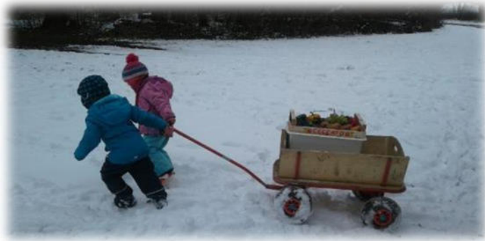
Abbildung 8: co.natur gGmbH Waldkindergarten Heimsheim

Im Sommer kann es sehr heiß werden, dann ist der Hauptaufenthaltsort der Wald, in dem es kühler ist und es wird darauf geachtet, dass die Kinder viel trinken und lange, aber dünne Kleidung und eine Kopfbedeckung tragen, am besten mit Nackenschutz.