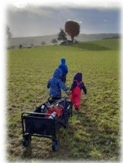
Abbildung 10: co.natur gGmbH

Um 8.30 Uhr beginnt der Begrüßungskreis. Hier werden Begrüßungslieder gesungen, die anwesenden Kinder und Betreuungspersonen gezählt und gemeinsam überlegt, welche Kinder fehlen. Dann geht die Gruppe auf Expedition in den Wald. Ggf. kann es auch Aktionen am Bauwagenplatz geben, wie z.B. Vorschule, Essenszubereitung oder Freispiel. Zwischen 12.30 Uhr und 13.30 Uhr können die Kinder am Bauwagen/Waldgrundstück abgeholt werden. Die Betreuungspersonen haben dann auch Zeit für Tür- und Angelgespräche.