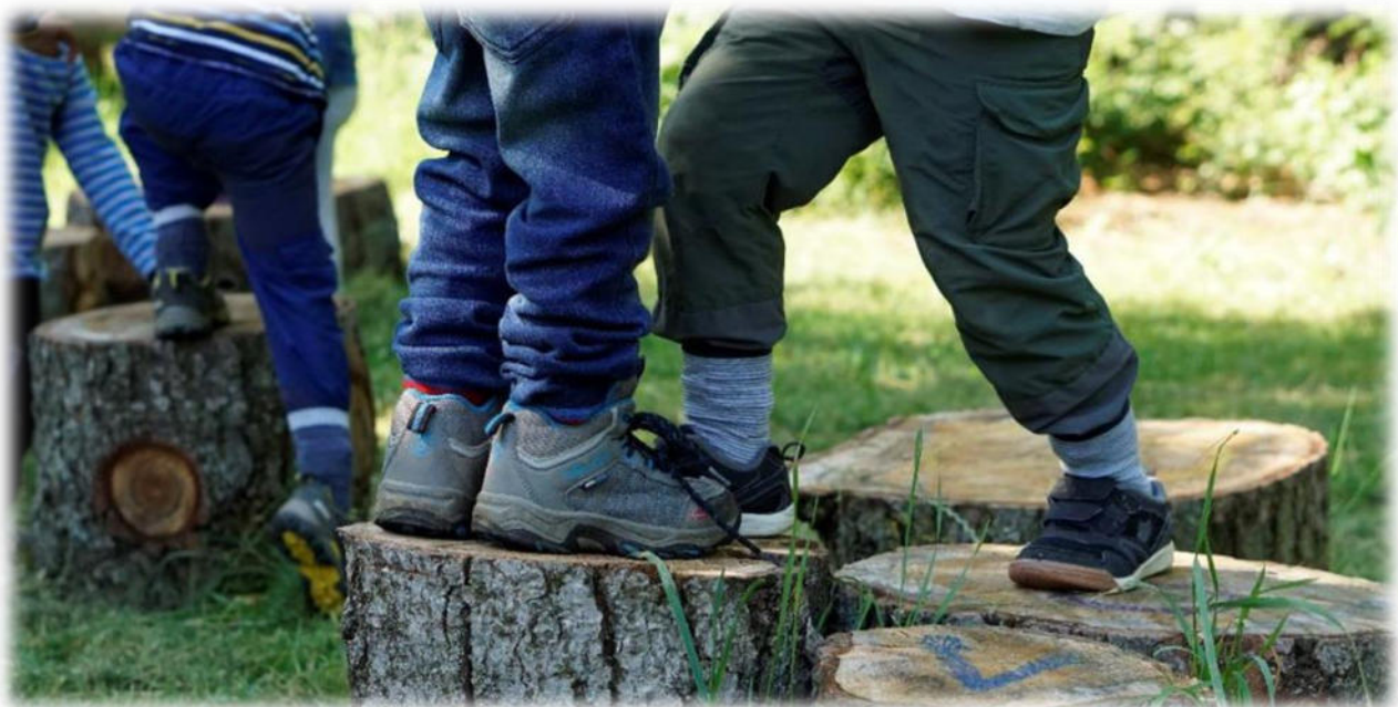
Abbildung 24: co.natur gGmbH Waldkindergarten Heimsheim

Während dem Freispiel wird die Selbständigkeit der Kinder gefördert, denn sie müssen entscheiden, wo, was und mit wem sie spielen wollen. Die Kinder erleben sich als autonom (sie entscheiden selbst, kein Erwachsener entscheidet für sie). Die können spielerisch die Sprache lernen, sich ausprobieren, neue Spiele kennenlernen und in ihrer eigenen Welt versinken. Außerdem wird die Motorik gefordert und gefördert und die Fantasie angeregt.