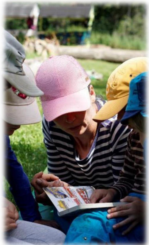
Abbildung 13: co.natur gGmbH Waldkindergarten Heimsheim

Das geplante pädagogische Personal setzt sich aus 3-4 Fachkräften, in Voll- oder Teilzeit mit unterschiedlichen Qualifikationen zusammen. Wir stellen also ein vielfältiges Team, in das sich jeder durch verschiedene Alters- und Lebenserfahrungen einbringen kann.