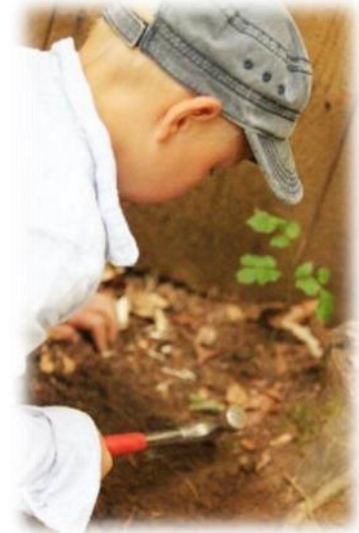
Abbildung 19: co.natur gGmbH Waldkindergarten Heimsheim

und auf freies Spiel. Die Merkmale des lebenspraktischen Ansatzes sind, dass die Kinder erleben, gebraucht zu werden. Es soll ein gesunder Ausgleich zwischen Kollektiv- und Individualsinn und zwischen praktischem Tun und völlig freiem Spiel sein.