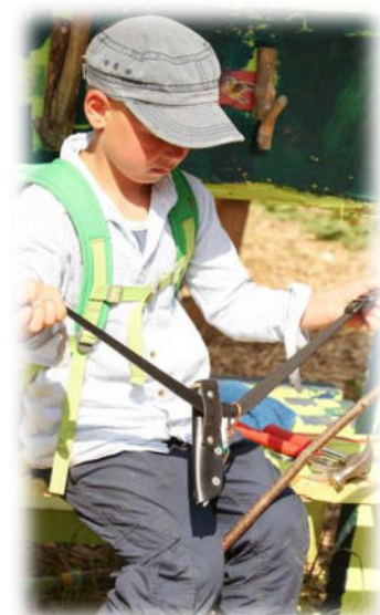
Abbildung 32: co.natur gGmbH Waldkindergarten Heimsheim