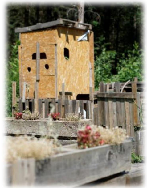
Abbildung 12: co.natur gGmbH

Aufgrund der Autarkie bietet es sich bei uns an, das Thema Umwelt- und Naturschutz immer im Alltag zu thematisieren. Es beginnt damit, dass wir Feuer brauchen, damit es uns warm ist und wir kochen und abwaschen können. Somit gehen die Kinder regelmäßig kleines Brennholz zum Anfeuern suchen und wir thematisieren dabei die Kreisläufe in der Natur und wieso die Pflanzen so wichtig für uns sind. Es gibt auch kein fließendes Wasser. Das bedeutet, wir gehen sparsam und effektiv mit dem Wasser um, was wir haben. Wir fangen Regenwasser auf, um die Beete zu gießen. Auch das Wasser vom Händewaschen (mit biolog. Seife) fangen wir auf und gießen damit unsere Sträucher. Wir erhitzen Wasser, um zu kochen und Geschirr zu spülen. Wir sind uns der Endlichkeit unserer Ressourcen im Alltag bewusst und leben sparsam und nachhaltig.