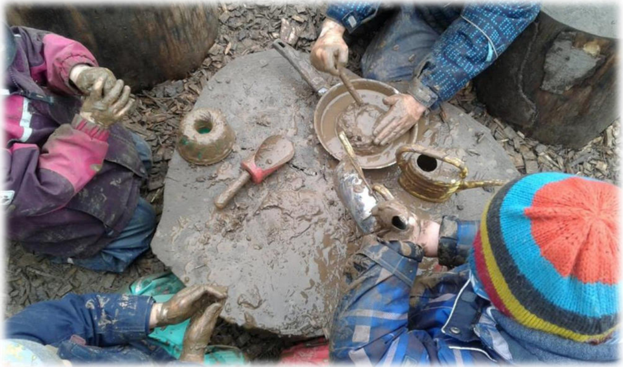
Abbildung 27: co.natur gGmbH Waldkindergarten Heimsheim

Der Spracherwerb gilt als Schlüsselkompetenz, denn durch Sprache eröffnen sich den Kindern weitere Entwicklungsfelder. Grundlegende Voraussetzung für den Spracherwerb ist das genaue Zuhören. Die Stille des Waldes bietet beste Voraussetzungen dafür. Zudem beeinflusst das Spielen mit Naturmaterialien die Sprachentwicklung positiv. Wenn ein Kind seinem Spielpartner erklären muss, ob sein Stock ein Zauberstab oder eine Lanze ist, fördert das automatisch seine Sprachentwicklung.