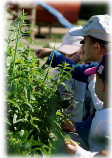
Abbildung 4: co.natur gGmbH Waldkindergarten Heimsheim

Es hat in der Kindergartenzeit lernen müssen, wo es sich Entspannung, Bewegung und Kraftquellen holen kann, um den fordernden Schulalltag durchzustehen. Kinder, die sich im Waldkindergarten Ressourcen geschaffen, erarbeitet und erfahren haben und dadurch wissen, wie sie in ihrer schulfreien Zeit wieder in die Balance zwischen Stillsitzen und Bewegen, zwischen Konzentration und Entspannung, zwischen Anstrengung und Ausruhen kommen können, werden den Schulalltag deutlich entspannter und gesünder überstehen.