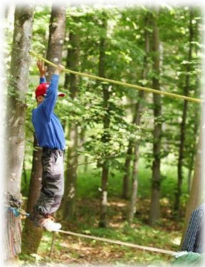
Abbildung 5: co.natur gGmbH Waldkindergarten Heimsheim

Für die Zukunft unserer Erde ist es von großer Bedeutung, dass wir beginnen, die Natur nachhaltig zu schützen. Hier gilt es bereits ganz früh einen Grundstein für den verantwortungsvollen Umgang der Kinder mit und in der Natur zu legen.